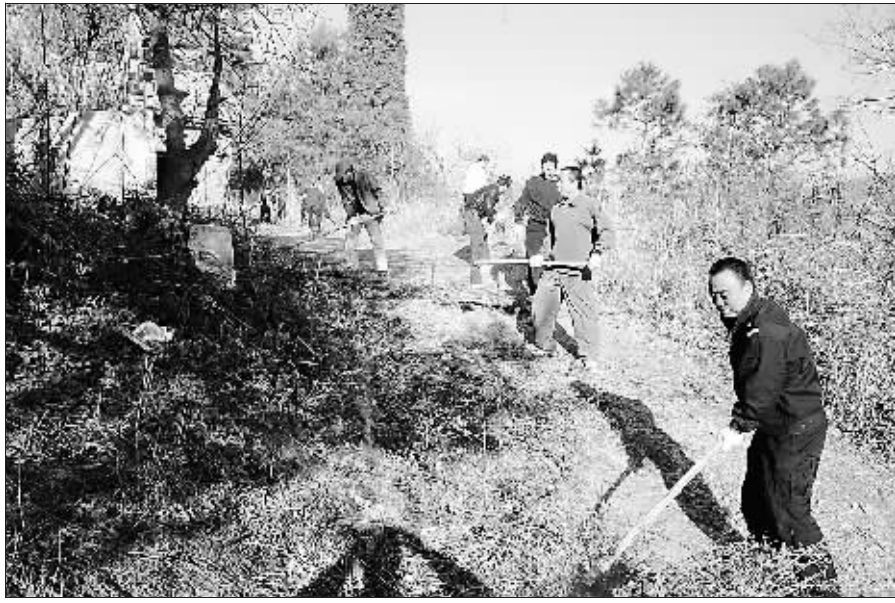
2月5日,麒麟区南宁街道党工委、办事处组织党员干部200多人,深入到金牛、水寨社区的林区,铲除杂草落叶,清除火灾隐患,扎实做好森林防火工作,积极应对旱情和高等级森林火警。

活动期间,该院还为镇一中教职员工和学生310余人次提供了义诊和健康咨询服务,发放各类药品价值4100余元。同时,为上村、灰洞村、后山村三个自然村开展义诊和健康咨询服务742人次,发放各类药品价值8400余元、赠送衣物804件套。 周毅