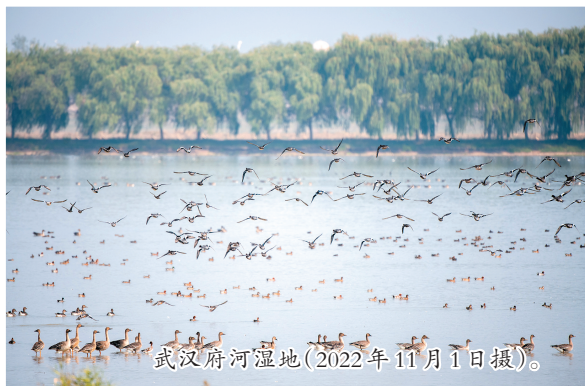
武汉府河湿地(2022年11月1日摄)