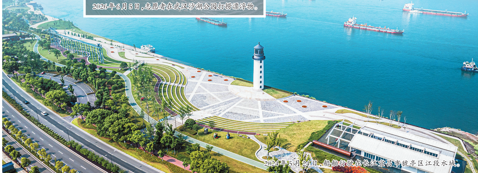
2024年5月24日,船舶行驶在长江宜昌市猗亭区江段水域。