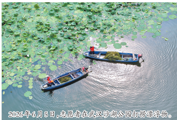
2026年6月5日,志愿者在武汉沙湖公园打捞漂浮物。