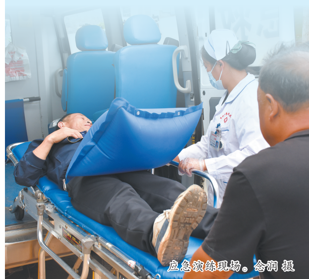
应急演练现场。