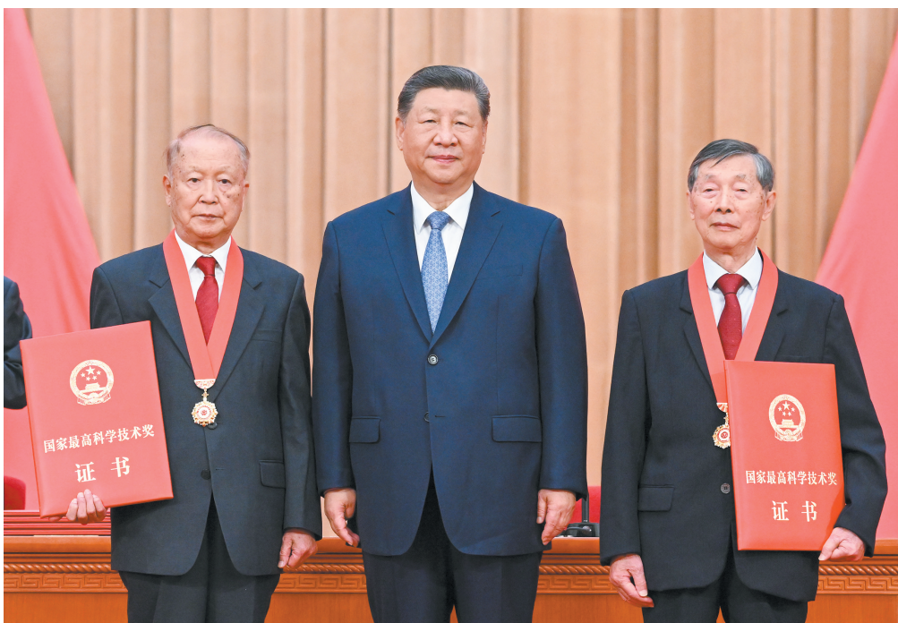
七月八日上午，国家科学技术奖励大会、中国科学院第二十二次院士大会和中国工程院第十八次院士大会、中国科学技术协会第十一次全国代表大会在北京人民大会堂隆重召开。中共中央总书记、国家主席、中央军委主席习近平向获得二〇二五年度国家最高科学技术奖的中国科学院物理研究所陈立泉院士(左)和中国电子科技集团第十四研究所贲德院士(右)颁发奖励。

新华社北京7月8日电 国家科学技术奖励大会、中国科学院第二十二次院士大会和中国工程院第十八次院士大会、中国科学技术协会第十一次全国代表大会8日上午在人民大会堂隆重召开。中共中央总书记、国家主席、中央军委主席习近平出席大会，为国家最高科学技术奖获得者等颁奖并发表重要讲话。他强调，“十五五”时期是科技强国建设的关键攻坚期。必须抓住历史机遇，迎接时代挑战，加快推进高水平科技自立自强，向着到2035年建成科技强国的目标坚定迈进，扎扎实实以科技创新支撑和引领中国式现代化。